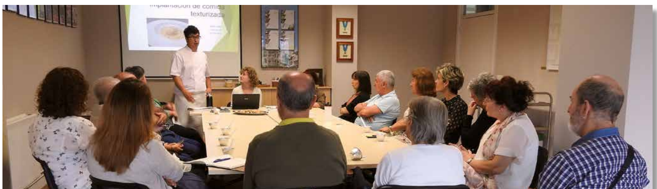
Sesión informativa dirigida a familias