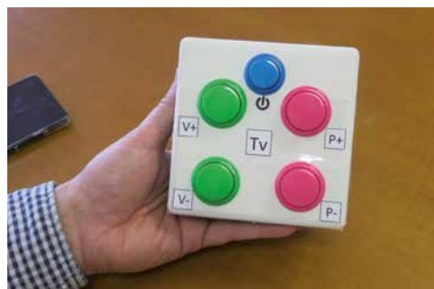
Mando de TV adaptado