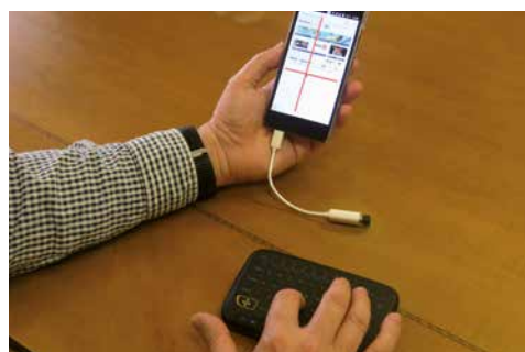
Demostración de uso de la aplicación Ease Touch