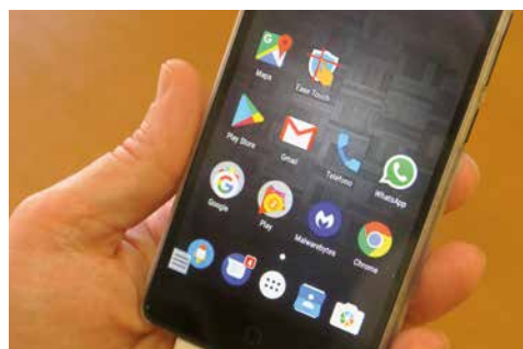
Aplicación Ease Touch